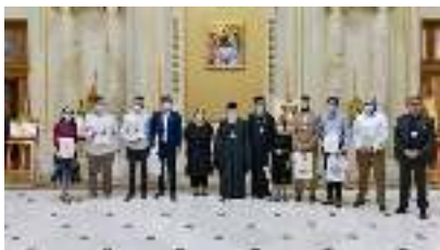
Premiera câștigătorilor Concursului Național Icoana ortodoxă – lumina credinței , ediția a XI-a

Obiectivul general al Concursului Național Icoana ortodoxă – lumina credinței este păstrarea tradițiilor religioase și culturale, prin punerea în valoare a talentelor în pictura bisericească. Obiectivele specifice ale ediției a XI-a a concursului sunt: ▪ promovarea artei bisericești autentice și a pictorilor iconari cu o abordare plastică și vizuală cât mai originală; ▪ evidențierea rolului rugăciunii și al icoanei în viața Bisericii și a credincioșilor; ▪ realizarea unui catalog al expoziției cu cele mai reprezentative icoane din concurs; ▪ facilitarea accesului credincioșilor la cumpărarea icoanelor și obiectelor canonice și reprezentative pentru arta bisericească românească.